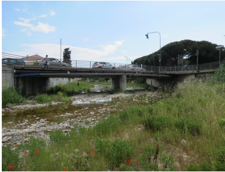
Figura 6 - stazione T4