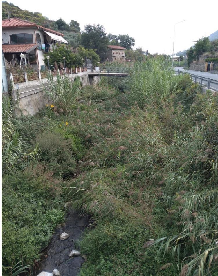
Figura 4 - stazione T2

Fonds européen de développement régional Fondo europeo di sviluppo regionale