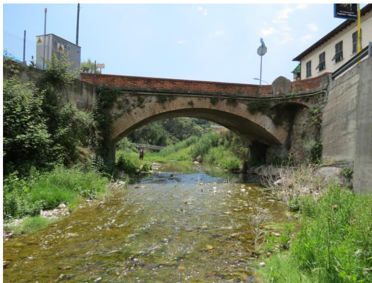
Figura 5 - stazione T3