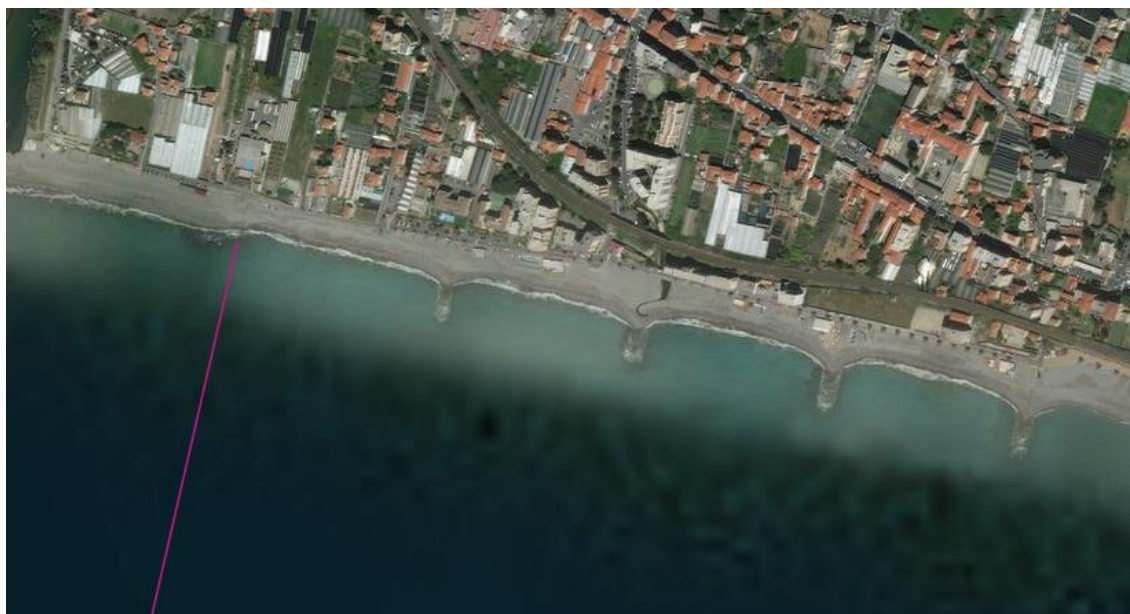
Figura 8 - stazioni C1-C2-C3-C4

Le modalità di campionamento e analisi dovranno rispettare le seguenti specifiche minime: