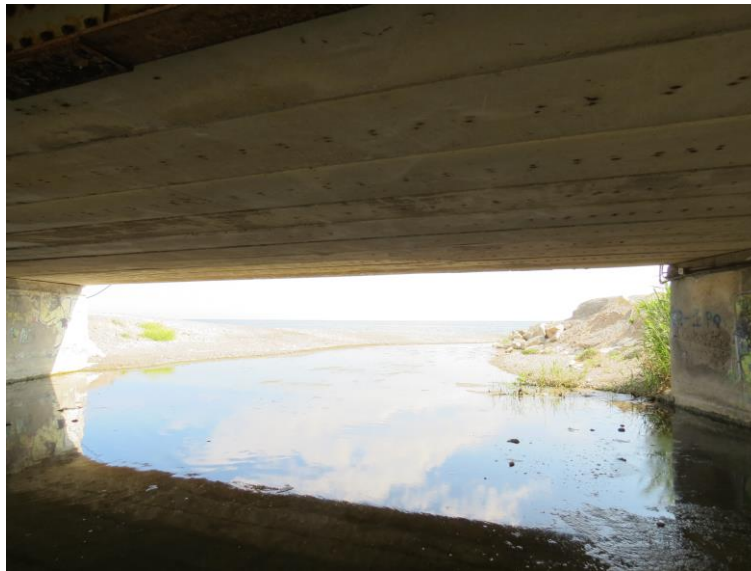
Figura 7 - stazione T5