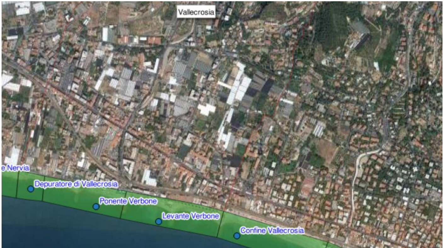
Figura 2 - mappa stralcio delle stazioni di prelievo delle acque destinate alla balneazione

Fonds européen de développement régional Fondo europeo di sviluppo regionale