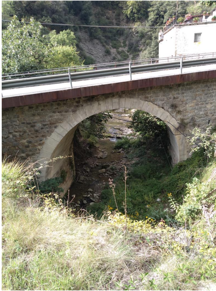
Figura 3 - stazione T1

Fonds européen de développement régional Fondo europeo di sviluppo regionale