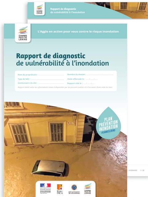
○ N°1 photo historique « choc »