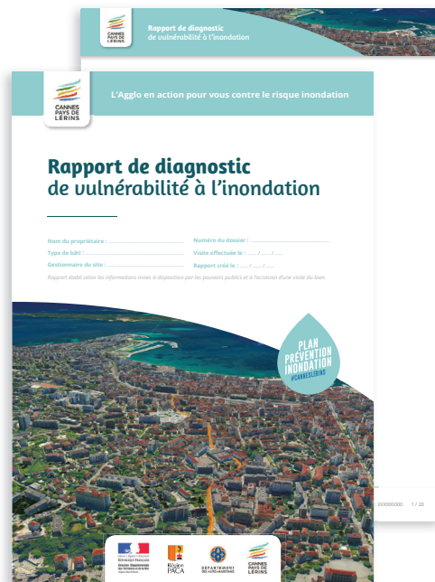
○ N°2 maquette 3D